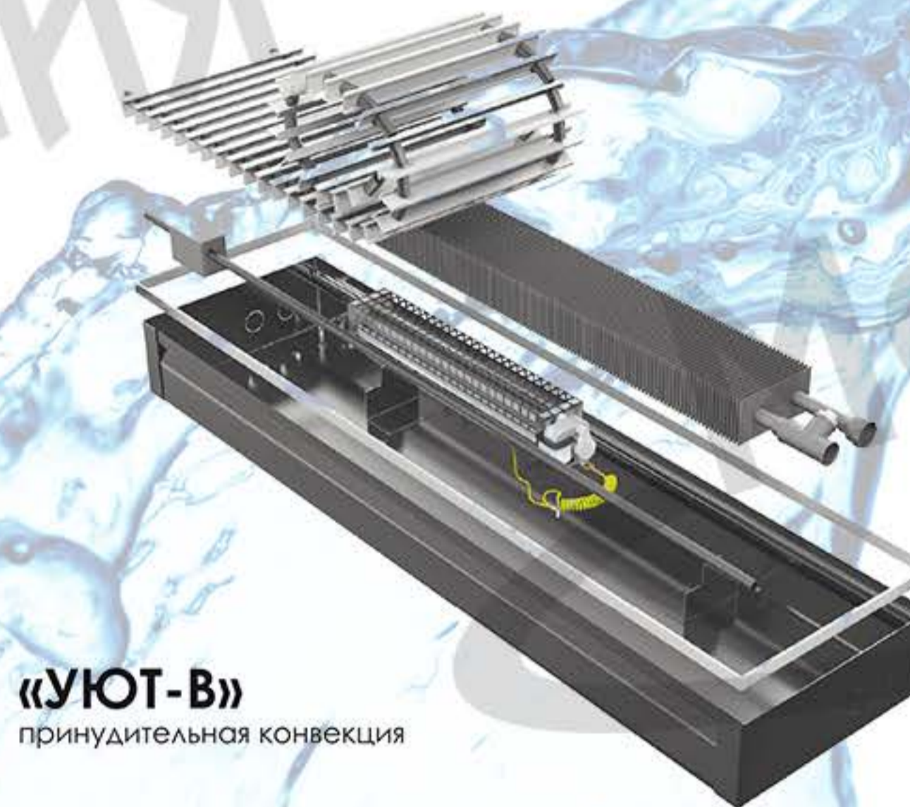
«УЮТ-В» принудительная конвекция