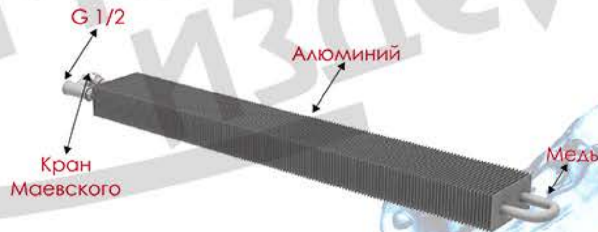
«УЮТ» 1ТО естественная конвекция